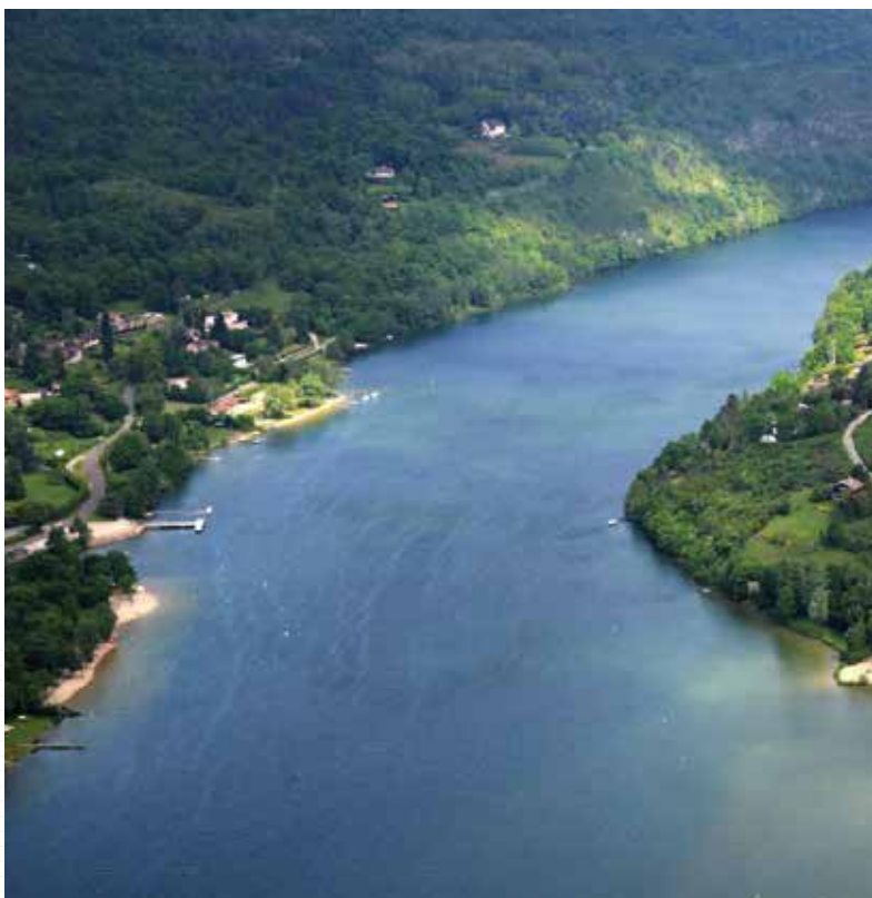
Le siège social de ACR est situé dans la Vallée de l'Ain

Une offre de solutions « métiers » conçue comme des plateformes Extranet modulaires, sécurisées, dédiées à votre entreprise.